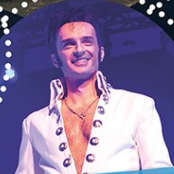
THE KING'S FRIENDS