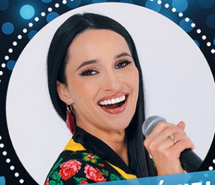
DAJ TO GŁOŚNIEJ